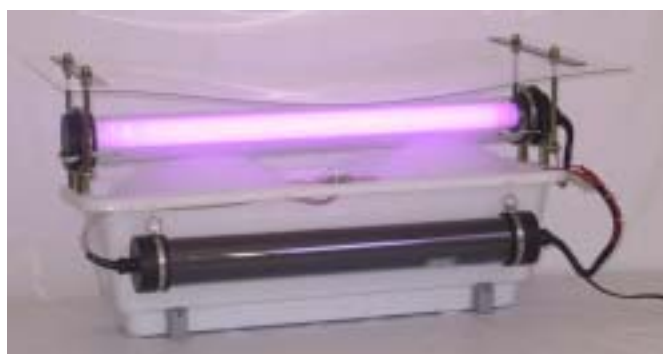
散水よけカバーはオプション