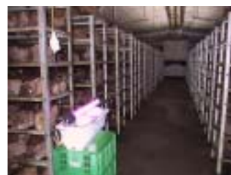
シイタケ園 設置例