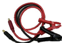
ブースターケーブル

KL-8AB-24B、36B ⇒22SQ×2m KL-8AB-48B⇒22SQ×3m KL-8AB-72B⇒38SQ×3m