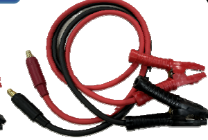
ブースターケーブル 38SQ×5m