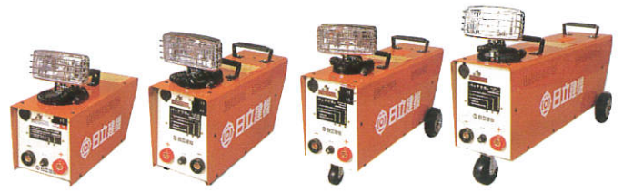
KL-8AB-20S KL-8AB-36B KL-8AB-48B KL-8AB-72B